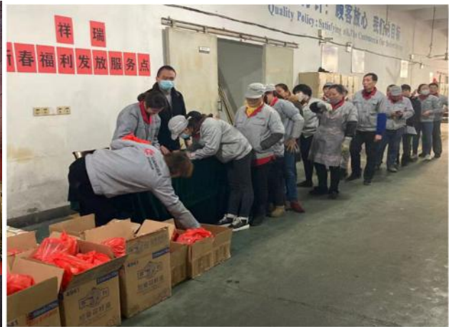
公司成立三十周年晚会、节日福利发放图片